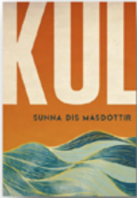
Sunna Dís Másdóttir