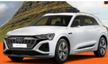
Audi Q8 e-tron Verð frá 13.490.000 kr.