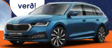
Škoda Octavia 4x4 Tilboðsverð: 6.490.000 kr.