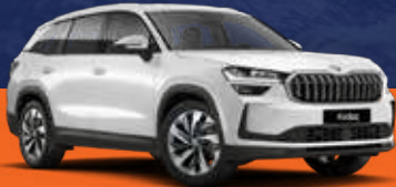
Nýr Škoda Kodiaq Verð frá 9.290.000 kr.