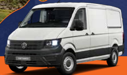
VW Crafter Verð frá 7.990.000 kr.